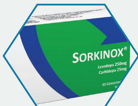
SORKINOX® (Levodopa - Carbidopa) 250/25 mg x 30 Comprimidos